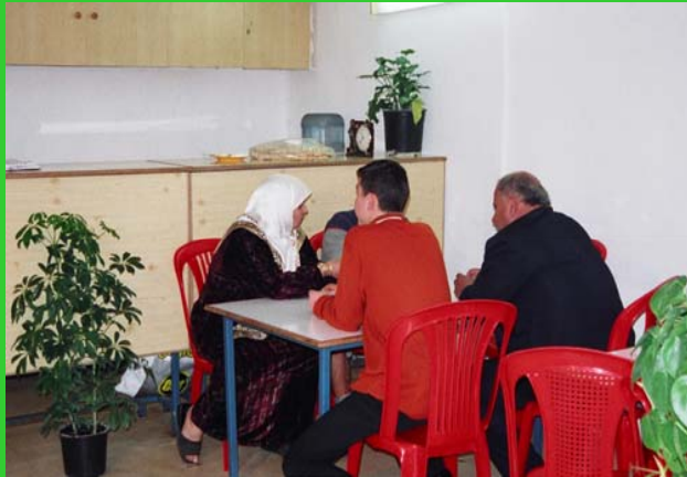
Parental visit room