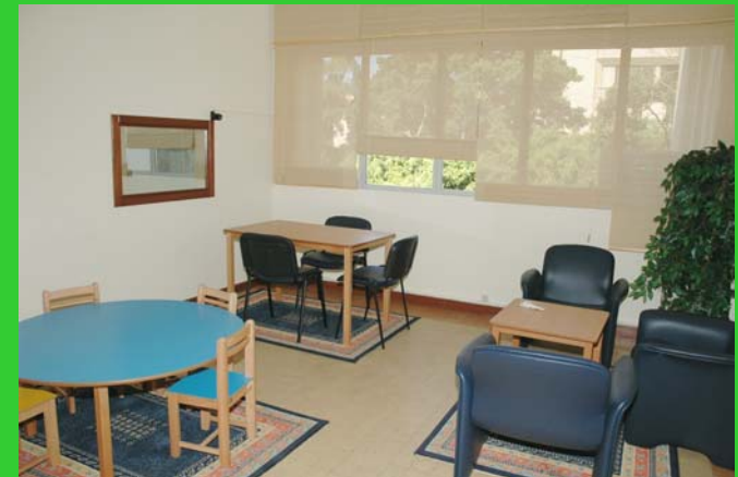
Child victim hearing room